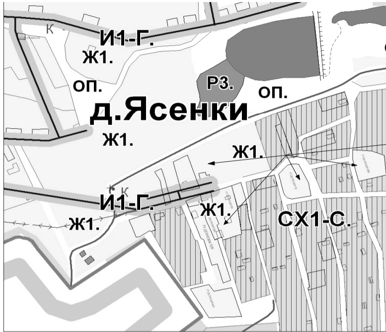
Фрагмент карты градостроительного зонирования ПЗЗ МО Яснополянское Щекинского района

Корректировка границы зон Ж1 в связи с уточнением местоположения земельных участков кад. № 71:22:020406:126; :280; :22; :12; :297.