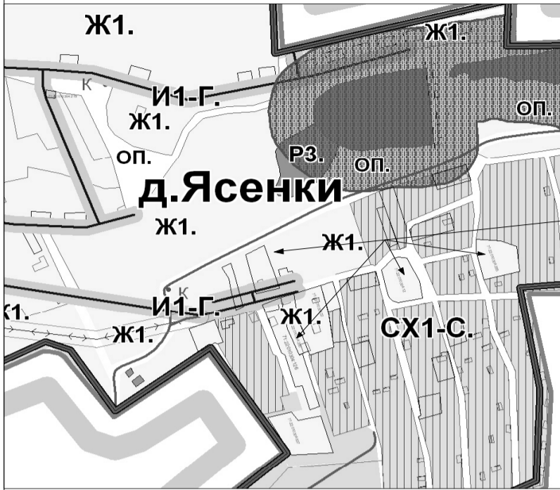
Фрагмент карты зон ограничений по экологическим и санитарно-эпидемиологическим условиям ПЗЗ МО Яснополянское Щекинского района

Корректировка границы зон Ж1 в связи с уточнением местоположения земельных участков кад. № 71:22:020406:126; :280; :22; :12; :297.