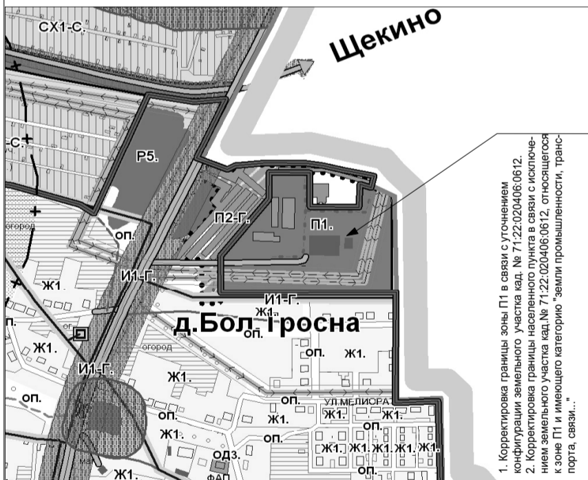
Фрагмент карты зон ограничений по экологическим и санитарно-эпидемиологическим условиям ПЗЗ МО Яснополянское Щекинского района

1. Корректировка границы зоны П1 в связи с уточнением конфигурации земельного участка кад. № 71:22:020406:0612. 2. Корректировка границы населенного пункта в связи с исключением земельного участка кад. № 71:22:020406:0612, относящегося к зоне П1 и имеющего категорию "земли промышленности, транспорта, связи..."