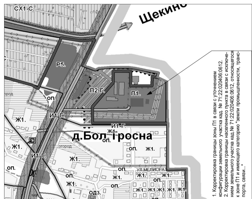
Фрагмент карты градостроительного зонирования ПЗЗ МО Яснополянское Щекинского района

1. Корректировка границы зоны П1 в связи с уточнением конфигурации земельного участка кад. № 71:22:020406:0612. 2. Корректировка границы населенного пункта в связи с исключением земельного участка кад. № 71:22:020406:0612, относящегося к зоне П1 и имеющего категорию "земли промышленности, транспорта, связи..."