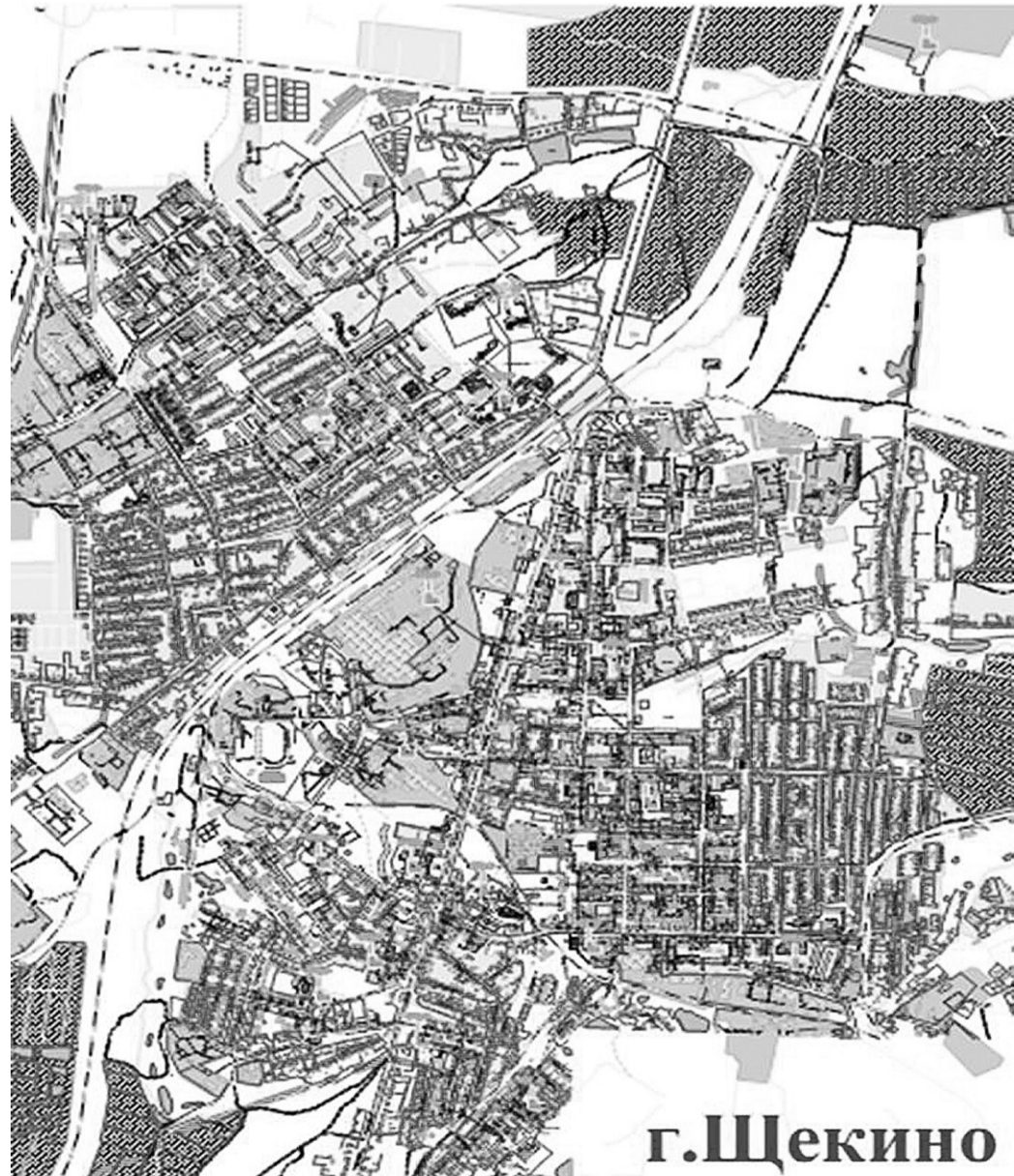
Рис.1. Расположение источников тепловой энергии в г. Щекино

Расположение источников теплоснабжения указано на рис. 1